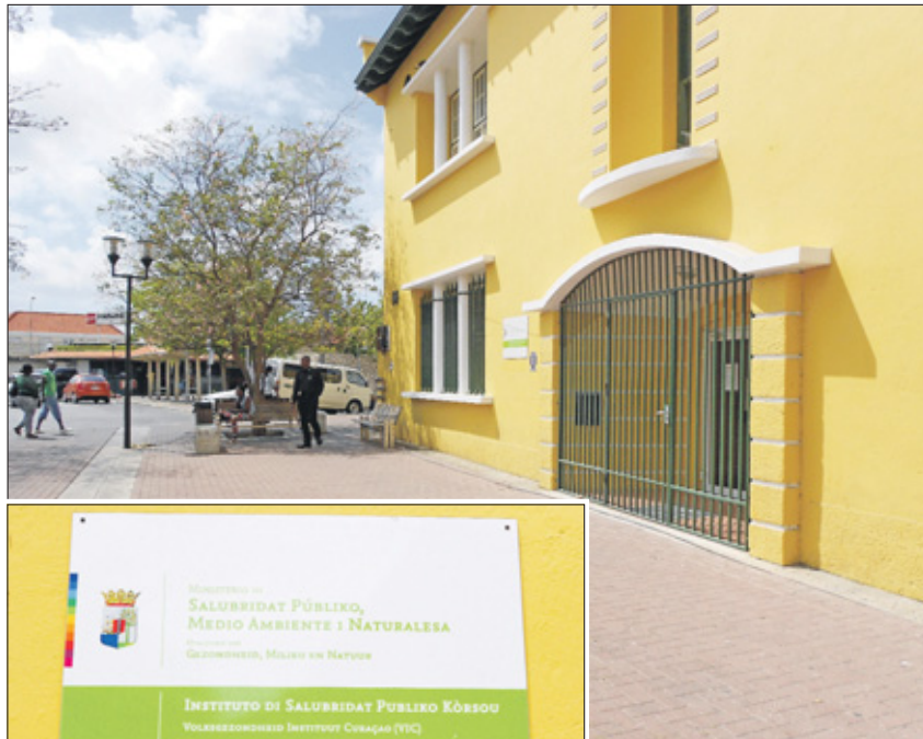
Het kantoor van VIC aan het Molenplein achter het busstation.

heidsorganisatie (WHO) is de definitie van gezondheid in 1946 al omschreven als 'een toestand van volledig lichamelijk, geestelijk en sociaal welbevinden en niet slechts de afwezigheid van ziekte of andere lichamelijk gebreken'. Mensen zijn, vanzelfsprekend, primair zelf verantwoordelijk voor hun gezondheid. De overheid speelt hierin echter ook een cruciale rol. De overheid is als het ware hoeder van de volksgezondheid; zij moet prioriteiten stellen en de effecten van het huidige volksgezondheidsbeleid analyseren. Bij het analyseren van het huidige beleid, komen gezondheidsindicatoren goed van pas; maar wat zijn