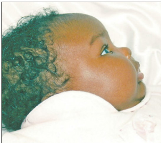
Bij 'demografische en socio-economische factoren', horen fertiliteitsratio, geboortecijfer, jaarlijkse bevolkingsgroei en levensverwachting.

Op Curaçao zijn de gezondheidsindicatoren geformuleerd binnen de thema's 'demografische en socio-economische factoren', 'mortaliteit' (dit is het sterftecijfer), 'morbiditeit' (dit is het ziektecijfer) en risicofactoren', 'gebruik en organisatie van de gezondheidszorg' en 'zorguitgaven'. Om een voorbeeld te geven: bij 'demografische en socio-economische factoren', kan gedacht worden aan indicatoren