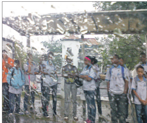
96 Procent van de Curaçaoese bevolking heeft toegang tot schoon drinkwater.

Gegevens voor 57 van deze indicatoren komen beschikbaar uit onderzoeken van VIC, zoals de Nationale Gezondheidsenquête. De gegevens voor de overige indicatoren komen uit andere bronnen zoals de SVB en andere zorgverzekeraars, zorginstellingen, het Centraal Bureau voor de Statistiek (CBS), bevolkingsregister Kranshi en de